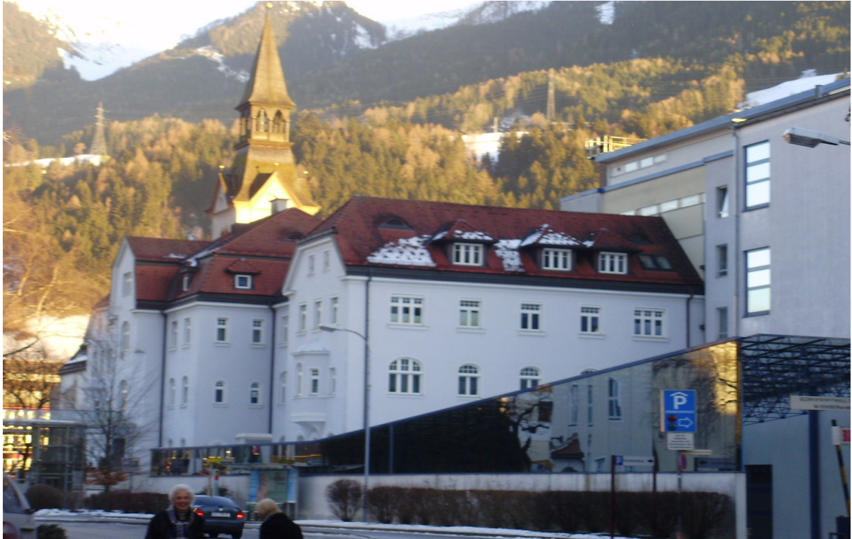
Bezirkskrankenhaus Schwaz, Haupteingang